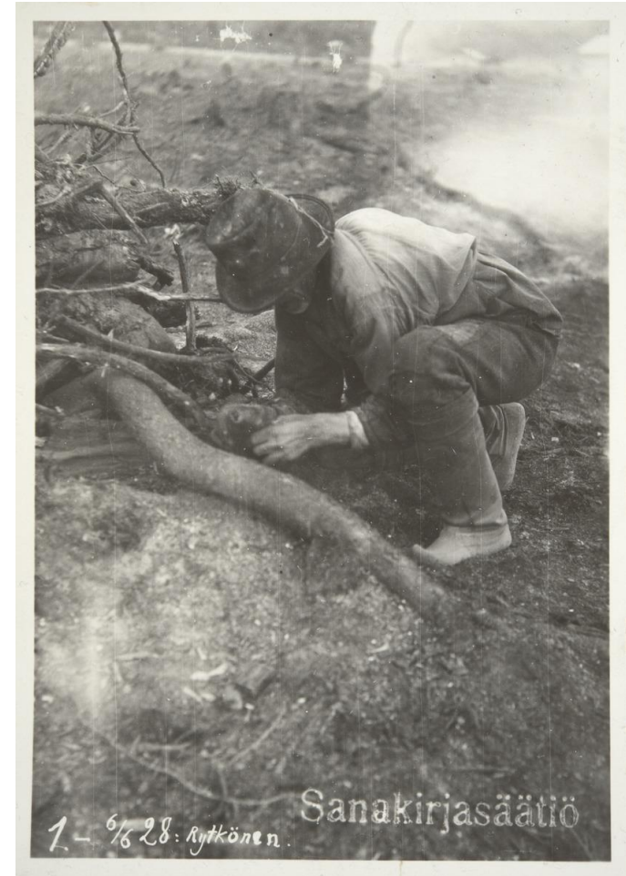
Kaskea sytytetään.