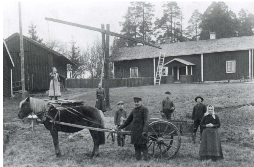
Mäki-Heikkilän väkeä talonsa pihalla Nurmijärven Palojoella 1913.