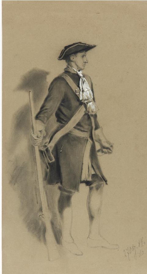
Sotilas 1700-luvun univormussa.