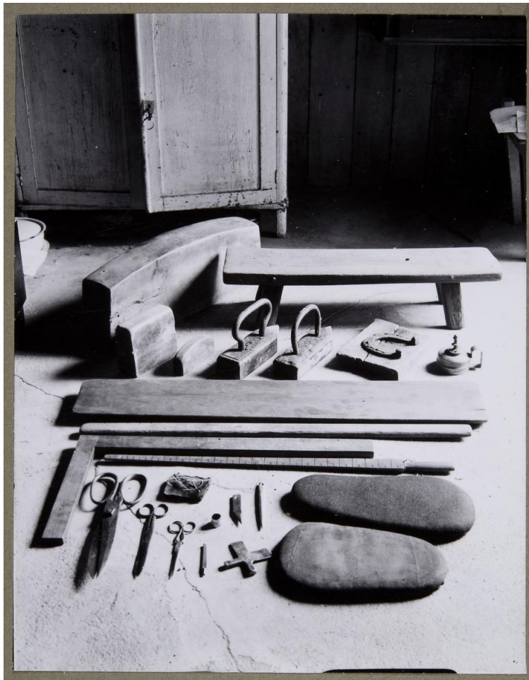
Räätälin työvälineitä.