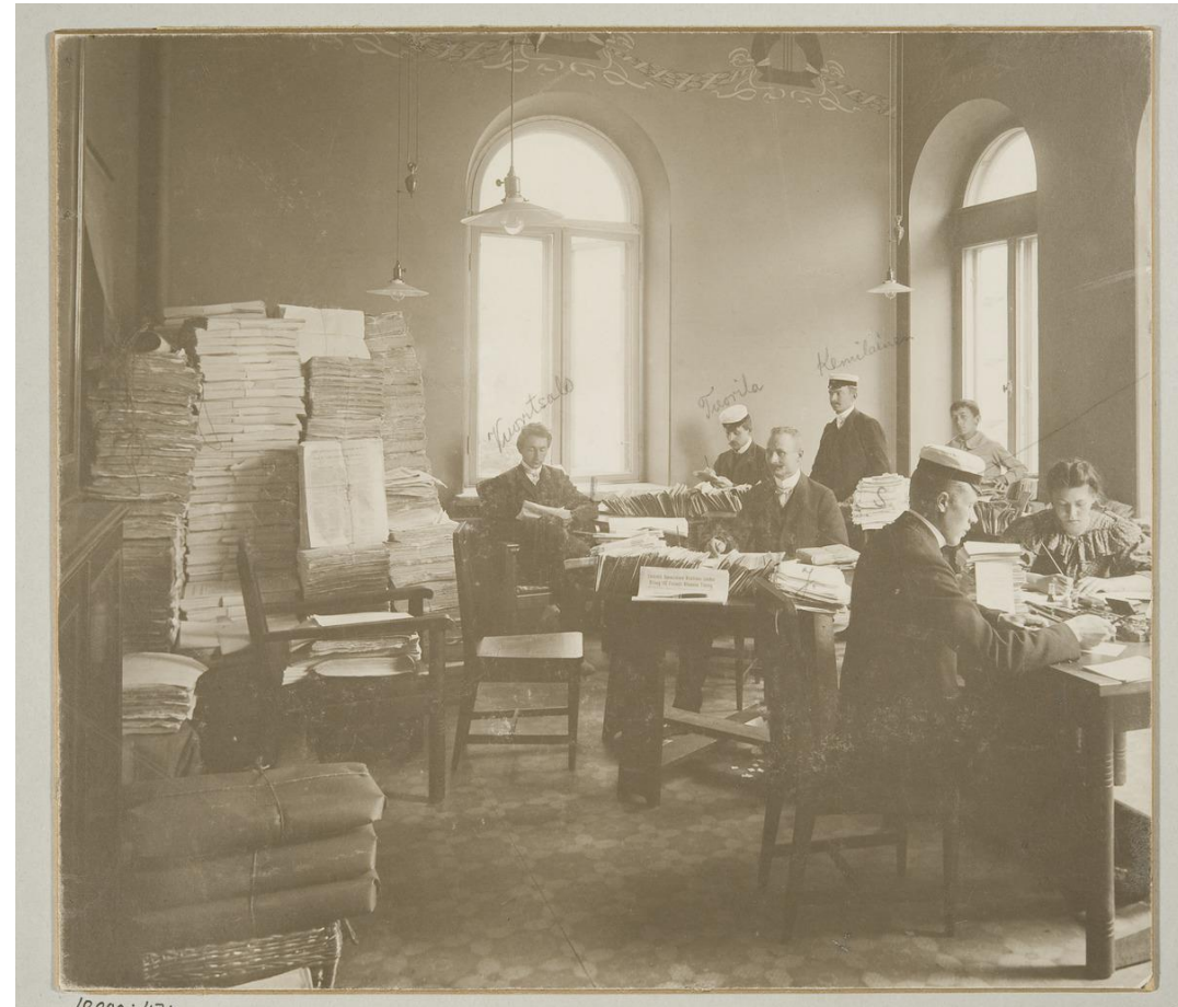
Sukunimien suomalaistamisliikkeen toimisto Vanhalla ylioppilastalolla 1906.